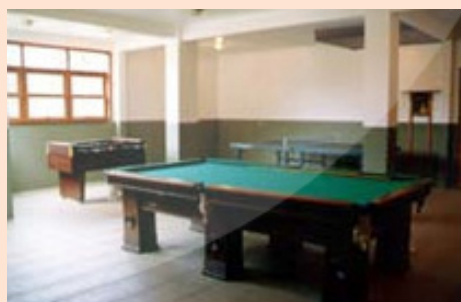
Recanto II - Lazer