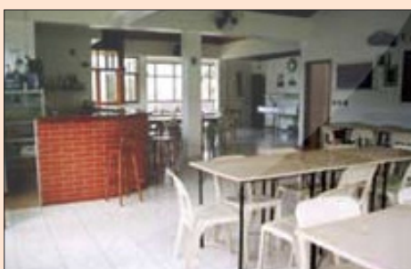
Recanto II - Restaurante