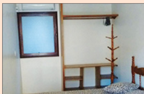
Recanto II - Dormitório