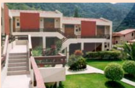
Recanto II - Jardim