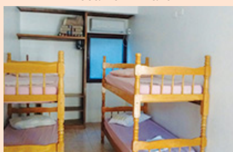
Recanto I - Dormitório