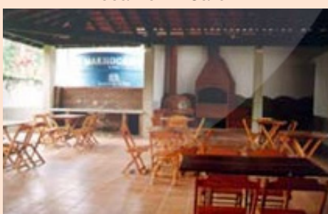
Recanto I - Churrascueiras