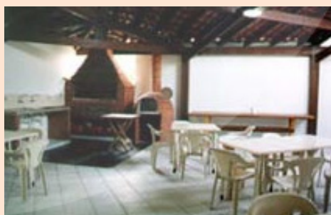
Recanto II - Churrascueira